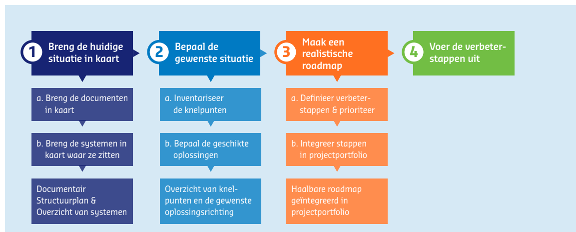
Figuur 2: schematisch overzicht documentmanagement